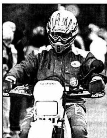
Seule une moto peut précéder le peloton.

Le peloton du Tour est bien encadré. Le premier concurrent