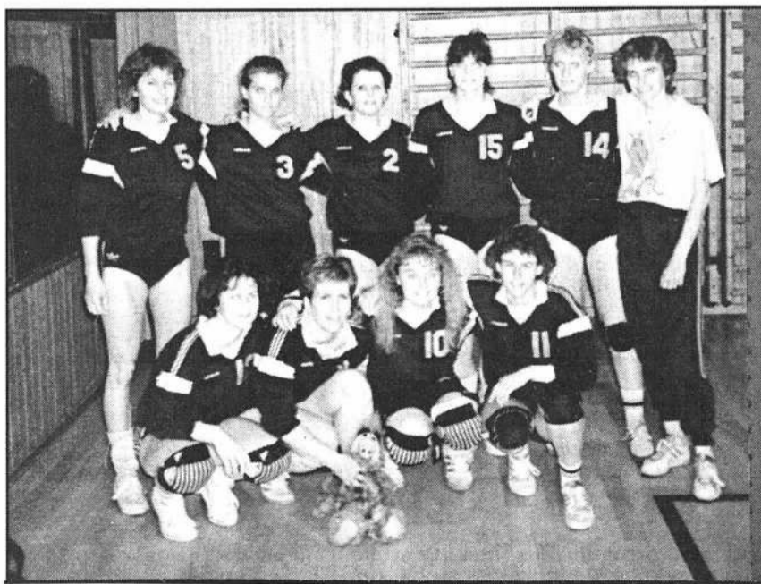
HEUREUSES - Les filles du NUC II ont bien mérité la promotion.