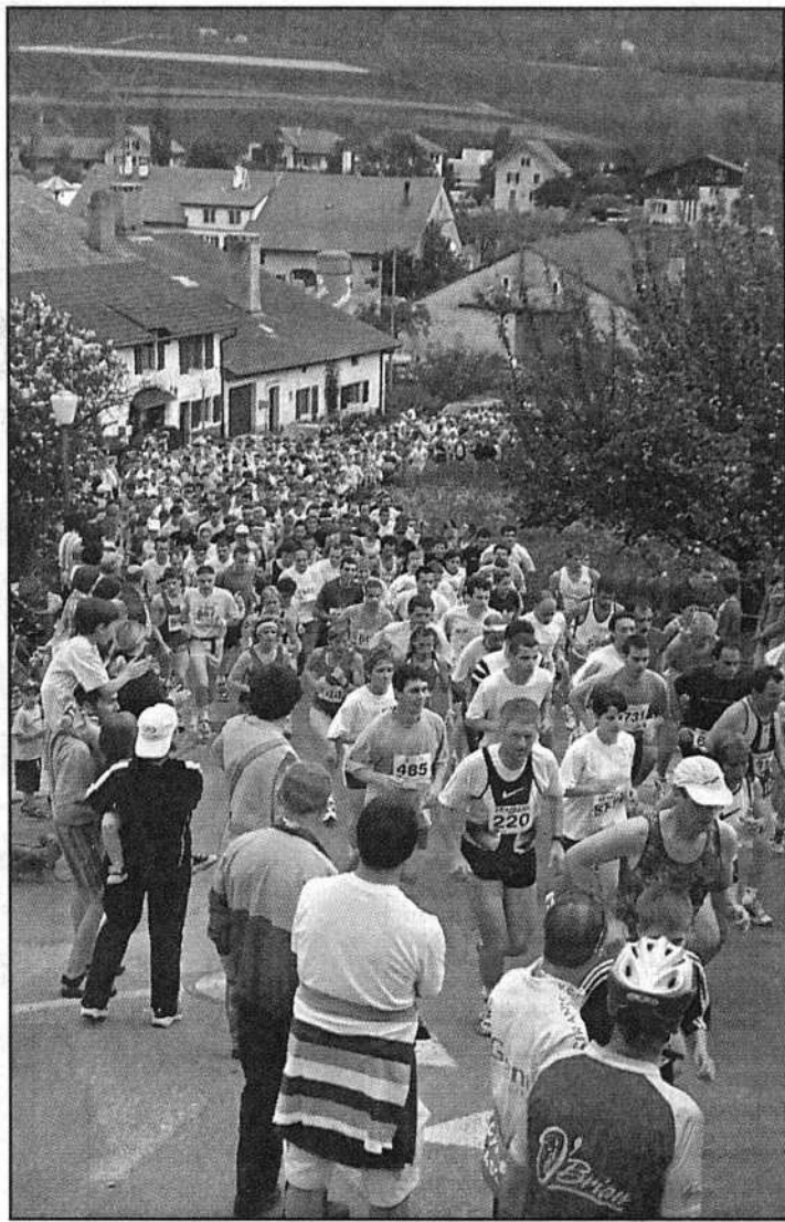
Hier à Dombresson, le peloton du Tour du canton a été épargné par la pluie, qui n'est tombée qu'une fois la dernière concurrente arrivée.