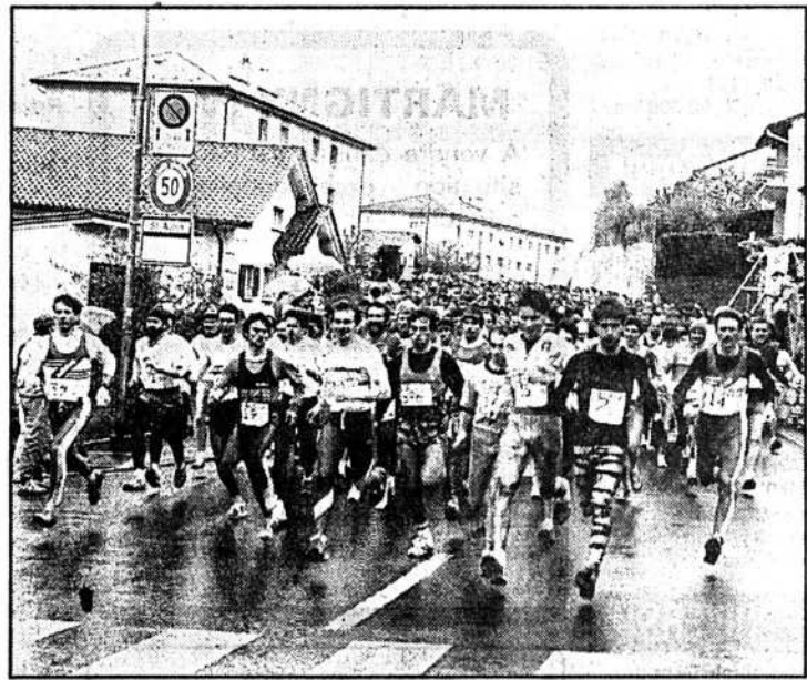
Le départ de Gorgier.