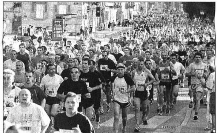
Le peloton a largement coloré l'avenue du 1er-Mars.