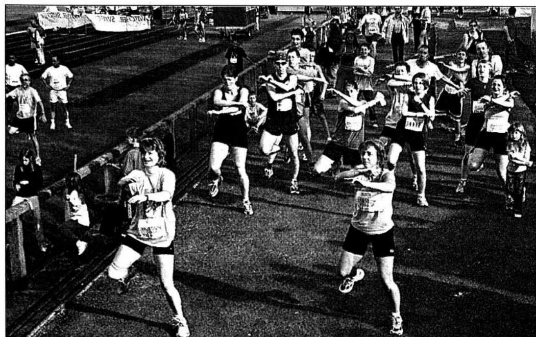
Un petit cours d'aérobic avant l'effort...

Belle animation au Centre sportif. Du soleil, du monde, quelques stands. Il n'en fallait pas plus. «C'est beau... C'est un peu comme l'Expo!» Les Chaux-de-Fonniers seraient-ils jaloux de leurs voisins du Bas? /PTU