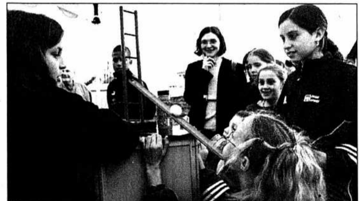
Les enfants se sont bien amusés. PHOTO GALLEY

Le traditionnel vélo-balai du TdCN a été remplacé hier soir par un coureur-balai. Explication: la personne chargée de boucler l'étape a cassé son dérailleur en début de course et a dû terminer à pied derrière les derniers concurrents. Espérons pour lui que la semaine prochaine sa bicyclette sera à nouveau en bon état. /JCE