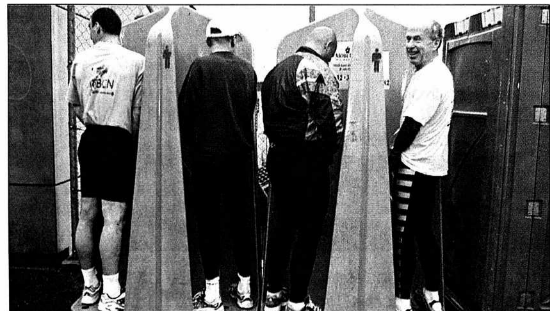
Une photo à vous couper le sifflet...

Une cabane près du départ. Voilà qui a fait le bonheur de quelques concurrents. Ils étaient tous adossés aux murs de la bâtisse en bois. La raison? La pluie bien entendu! /TTR