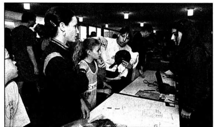
Que de travail, hier soir, pour les préposés aux inscriptions!

Qu'il en soit encore une fois remercié. /JCE