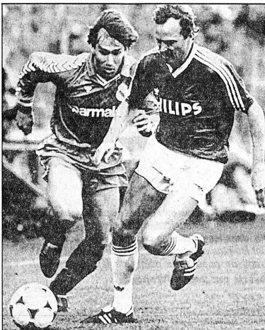
EN VAIN — Martin (à gauche) tente de passer van de Kerkhof, en vain, tout comme Real ne passera pas face à Eindhoven.

L'arbitre suisse Bruno Galler a connu une sortie difficile. Les Espagnols, et plus particulièrement Michel, lui reprochèrent violemment une partialité qui ne sembla pas évidente depuis les tribunes. En fait, les Madrilènes étaient furieux contre eux-mêmes. Ils se voyaient éliminés par des opposants qui n'avaient pas manifesté une réelle supériorité. /si