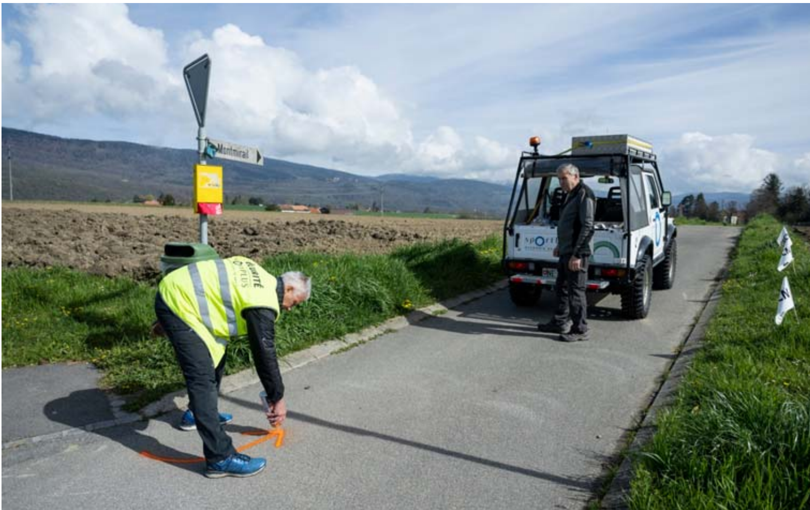
Reconnaissance de la première étape du BCN Tour, à Marin, avec les baliseurs.