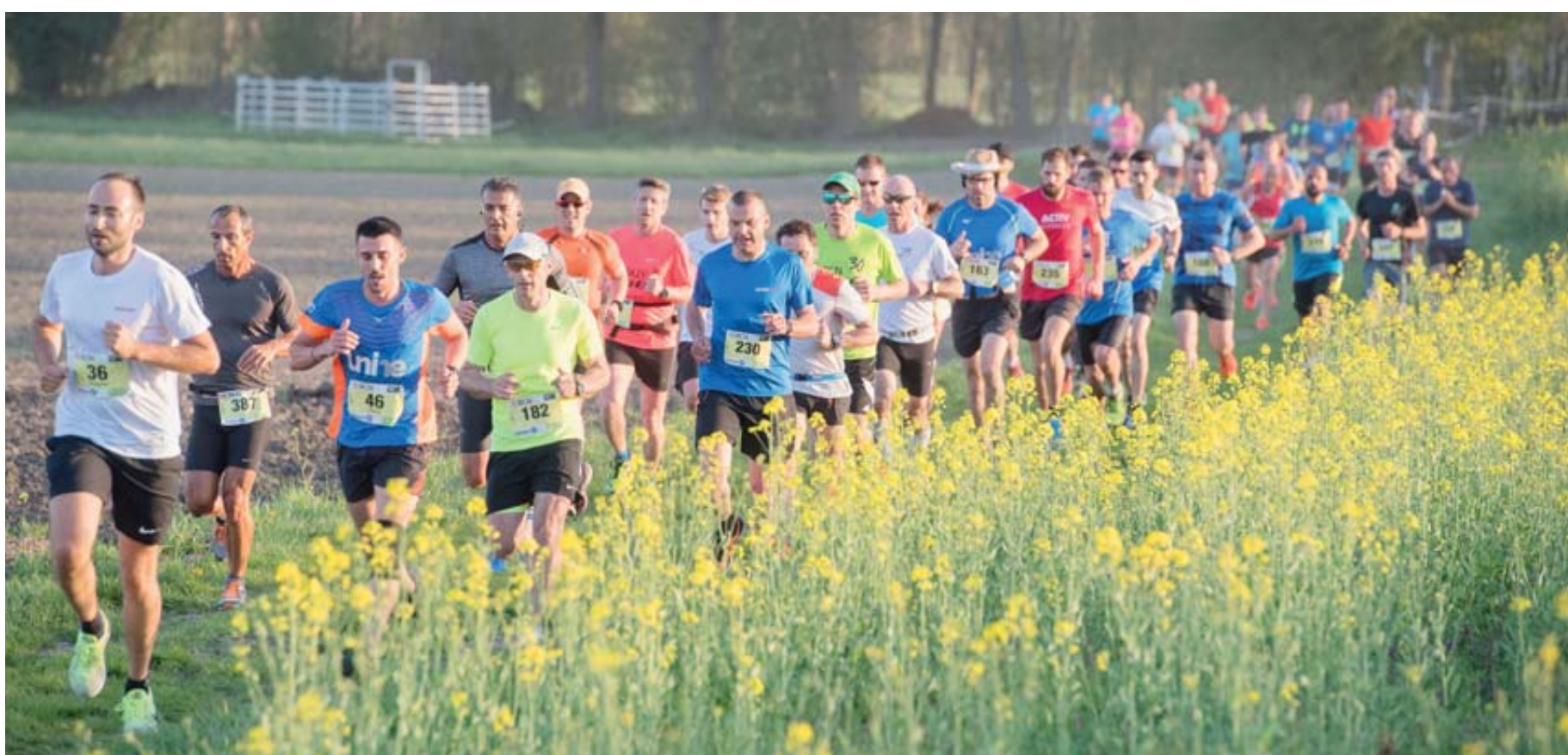
Le BCN Tour retrouvera Marin et ses près pour son retour, avec des étapes en peloton.

Si l'absence de grand rassemblement a permis aux organisateurs de proposer des parcours