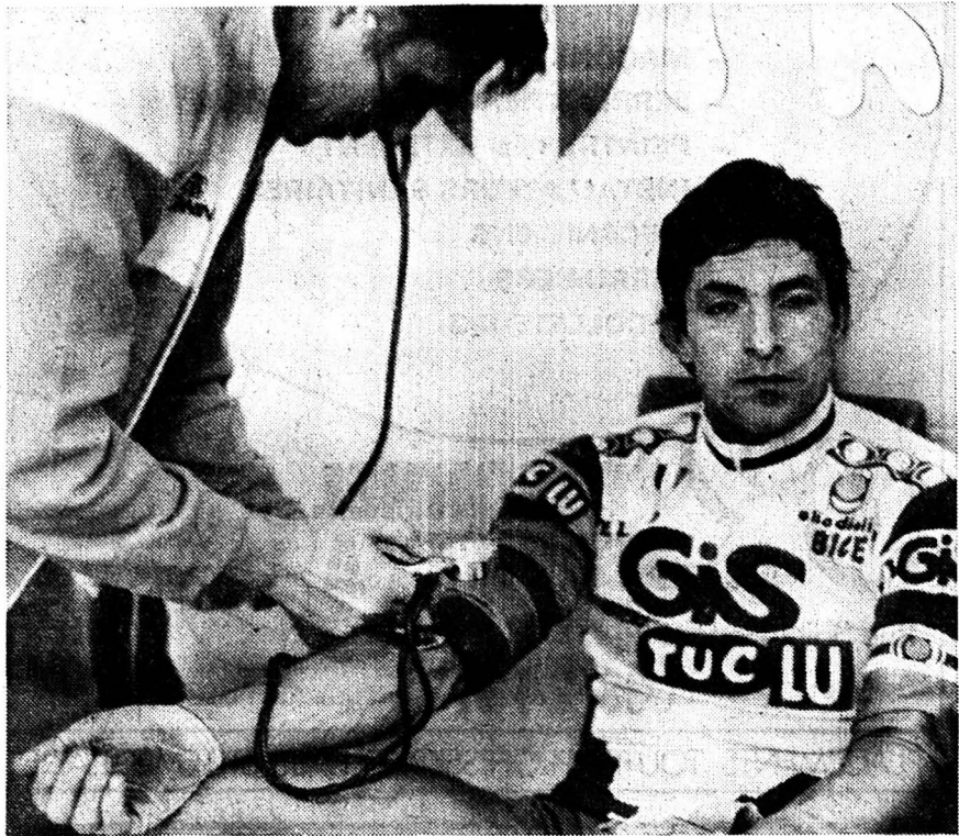
Francesco Moser, qui s'est découvert une nouvelle jeunesse, réussira-t-il enfin à gagner son premier Giro?

A 33 ans, Francesco Moser a tout connu. Des duels sévères avec Eddy Merckx, Bernard Hinault et surtout Giuseppe Saronni. Des triomphes, à la joie immense de presque tout un peuple, des défaites, génératrices d'oubli et presque d'anonymat. Il y a un an, au départ du Tour d'Italie, son nom était cité à grand peine parmi ceux des favoris. Cette fois, avant le prologue du Giro, aujourd'hui à Lucca, il figure dans toutes les conversations, bien avant ceux de Laurent Fignon et Roberto Visentini, ses principaux adversaires.