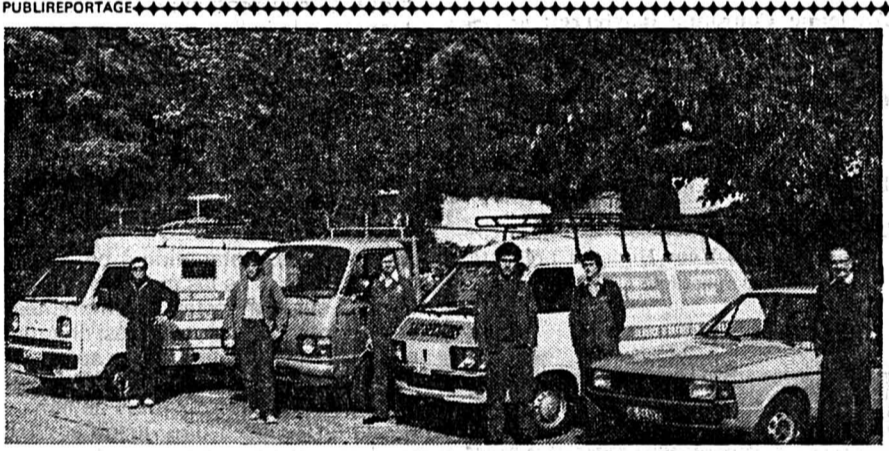
Une équipe bien entraînée pour un travail de qualité.

bien entraînés puisqu'ils ont en masse participé au Globe-Cross durant tout l'hiver et seront tout heureux de venir glâner quelques points pour le championnat neuchâtelois des courses hors stade. Nouveauté au programme, la catégorie minimes filles et garçons se courra à 11 h 15, directement après, la course des seniors. Le dimanche après-midi, dès 14 heures, se dérouleront les spectaculaires courses relais à l'américaine et le Stade de la Croix sera le rendez-vous des athlètes qui participeront au saut en longueur et au lancer du poids. J.-C. R.