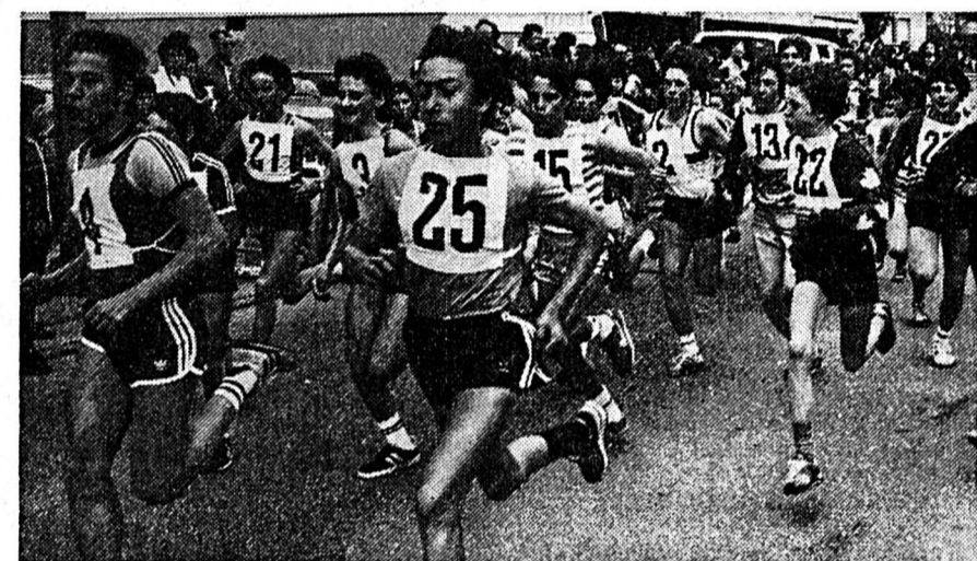
En 1985, les cadets et cadettes B au départ.

Corcelles pour parcourir le territoire de Colombier en passant par le domaine de Chambleau et redescendre au point le plus bas la route du Ceylard domaine des Perchettes... La remontée sur Cormondrèche par le chemin de la Portette termine une boucle de 5 km 150 à parcourir deux fois. Les organisateurs attendent du monde, les coureurs doivent être